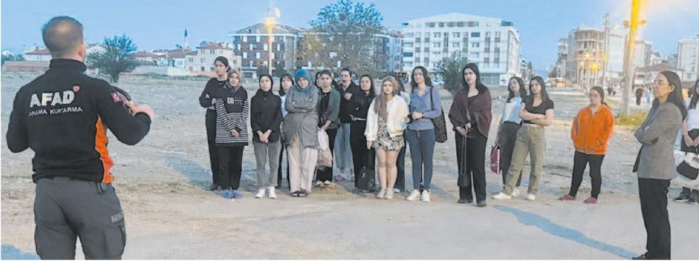
Tatbikat sırasında öğrenciler, siren sesini duyduktan sonra afet sırasında yapılması gereken tahliye yollarını doğru şekilde uygulayarak binadan güvenli bir şekilde tahliye edildi.

D estine Hatun Kız öğrenci yurdunda yapılan afet farkındalık eğitimi ve yangın tahliye tatbikatı ile deprem anında ne yapılması gerektiğine yönelik eğitim düzenlendi. İl Afet ve Acil Durum Müdürlüğü (AFAD) eğitmeni Münircan Karakoç tarafından verilen eğitimler, öğrencilere afetlerle başa çıkma konusunda bilinçli ve hazırlıklı olma bilincini aşıladı. AFAD uzmanları tarafından verilen eğitimlerde, afet öncesi, afet anında ve sonrasında yapılması gerekenler anlatıldı.